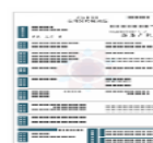
保険証券 (現在自動車保険に加入している方のみ)